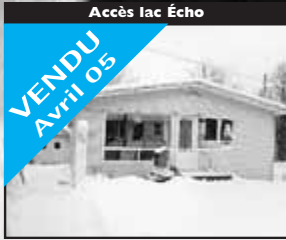
Accès lac Écho

VENDU Avril 05 Sur terrain de 39 000 p.c., spacieuse, plafond 10 pi., boiserie, véranda, pisc. HT. 268 500 $