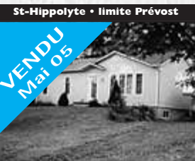
St-Hippolyte • limite Prévost

VENDU Avril 05 Vue panoramique, propriété 2005, haute qualité, cuisine design professionnel, planchers de bois, S.S. fini, verrière. 285 000 $