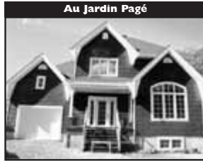
Au Jardin Pagé

Cachet de campagne irrésistible, sur beau terrain avec forêt arrière, retirée de la route, belle cuisine, accès ext. sous-sol, garage double. — 339 000 $