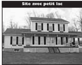
Site avec petit lac

Résidence de prestige, avec vue panoramique, piscine creusée, aménagement paysage pro, haute qualité, air climatisé, beau S-S. 379 000 $