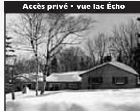
Accès privé • vue lac Écho

Wow, quel design! Grand balcon attenant à la chambre des maîtres, vue panoramique, piscine creusée, plancher de bois exotique rez-de-chaussée. Bel escalier, s-sol fini, garage double. 425 000 $