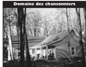
Domaine des chansonnières

Sur terrain de 23059 pc adossé au parc de villégiature, superficie habitable de 2270 pc, 3 Salle de bain, garage double. 325 000 $