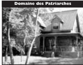
Domaine des Patriarches

Secteur lac Écho, propriété 2004, design remarquable avec galeries 4 côtés, beau cachet intérieur, haute qualité. 369 000 $