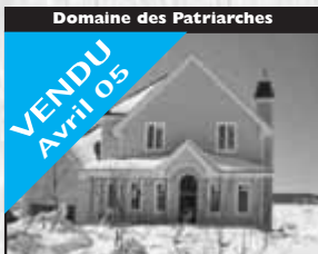
Domaine des Patriarches

VENDU Avril 05 Impeccable, 3 CÀC même niveau, planchers de marqueterie, terrain de 15 000 pc, salle familiale, sous-sol, Pisc. HT 154 900 $