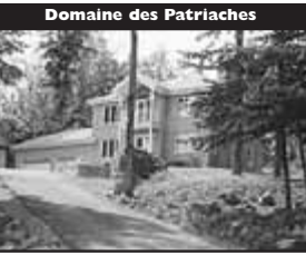
Domaine des Patriarches

Design exceptionnel! Magnifique salon/verrière en rond offrant vue panoramique, Bureau au 3 e balcon dans les chambres, Beau terrain avec vue et jardin d'eau, haute qualité 249 000 $