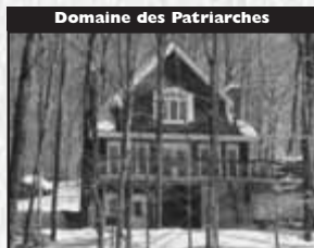
Domaine des Patriarches

VENDU Mai 05 Grand bungalow 1995, impeccable, rue sans issue, forêt arrière, spacieux, cabanon 16x10, S.S. fini 8090. 162 5000 $