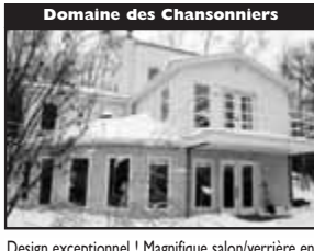
Domaine des Chansonnières

Magnifique plain pied, 3 CÀC, planchers de pin rouge, bureau, garage, véranda. 249 000 $