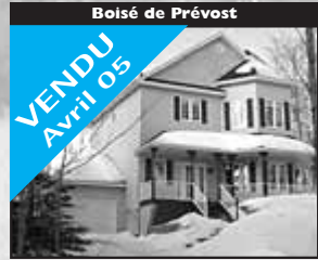
Bois de Prévost

VENDU Avril 05 Sur terrain de 39 000 p.c., spacieuse, plafond 10 pi., boiserie, véranda, pisc. HT. 268 500 $