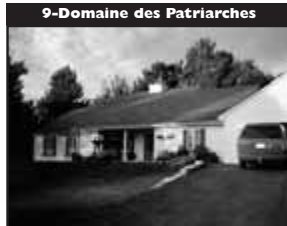
9-Domaine des Patriarches

Belle canadienne, impeccable, ensoleillée, 4 CÀC, beau foyer de pierre, vue panoramique. 289 000 $