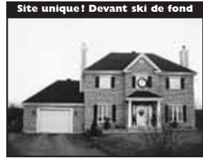
Site unique! Devant ski de fond

Magnifique site de 50870 pc, garage double, forêt arrière, intérieur spacieux, 4 CÀC, salle familiale, rez-de-chaussée 189 900 $