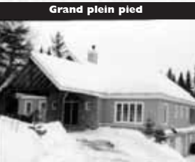
Grand plain pied

Belle suisse, près du village, avec logis 5 1/2, ou intergénération. 185 000 $