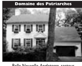
Domaine des Patriarches

Jolie maison, 3 CÀC, s-sol fini, beau terrain privé. 144 000 $