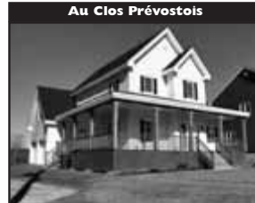
Au Clos Prévostois

Avec forêt arrière, magnifique secteur, bel intérieur 3 CÀC, sous-sol fini, foyer Jotul, armoires de cuisine de bois. 249 000 $