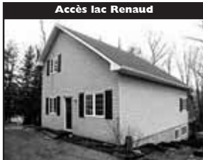
Accès lac Renaud

Vue panoramique sur les montagnes, bel intérieur, 5 CÀC, salle familiale, rez de chaussée, 2 foyers. 267 500 $