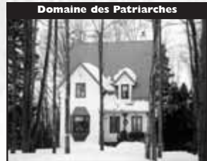
Domaine des Patriarches

Sur grand terrain avec services, forêt arrière, planchers de bois exotique spacieux, ensoleillée. 229 500 $