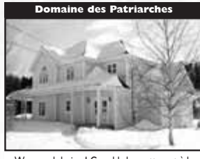
Domaine des Patriarches

Belle canadienne chaleureuse sur terrain de 39 850 pc, 4 cac, rue sans issue, près de la 117, pisc. creuse, foyer, 2 cabanons, 299 000 $