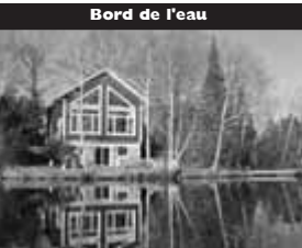
Bord de l'eau

À 2 mi. du lac, intérieur champêtre, cathédrale au salon, cuisine et salle de bains design, 3 CÀC. 178 500 $