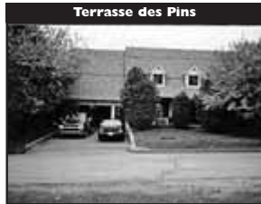
Terrasse des Pins

Vue saisissante sur le lac, construction 2004, sur terrain privé, belle cathédrale de bois, 3 CÀC, bureau, 2 SdB, Foyer de pierre. 349 000 $