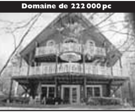
Domaine de 222 000 pc

3 CÀC, foyer, sous-sol fini à 80%, intérieur spacieux 234 900 $