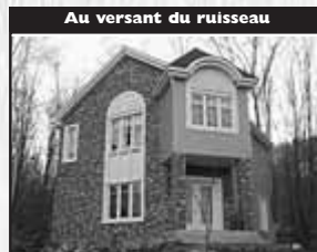
Au versant du ruisseau

Terrain de 37 000 pc, boisé privé, foyer combustion lente, 2 CÀC, salle-audio 214 900 $