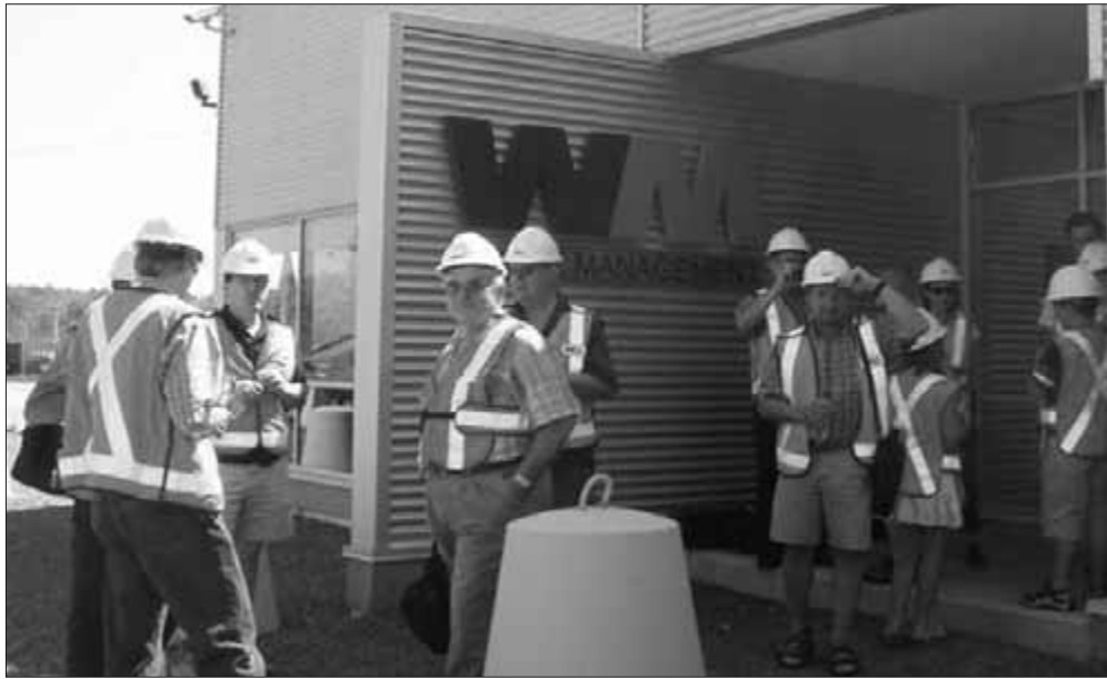
Une petite délégation de Prévost, composée des membres du Comité consultatif en environnement et de deux élèves de l'école Champ Fleuri, lors d'une visite au L.E.T. de Ste-Sophie en juin 2007.