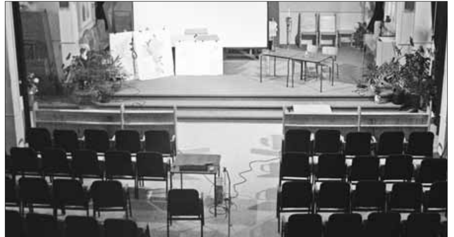
La nouvelle salle aménagée à l'église