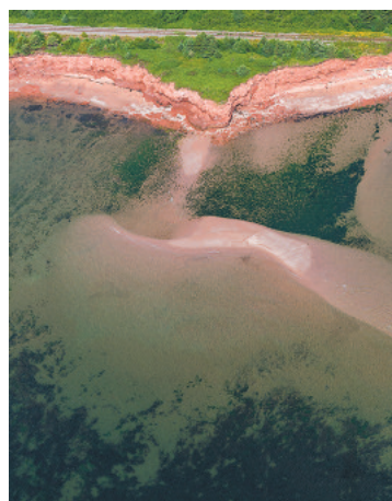
Érosion de Lucien Lisabelle

Nous vous attendons nombreux pour venir déguster muffin, café ou thé et nous avons le WIFI gratuit! Pour toute information, téléphonez-