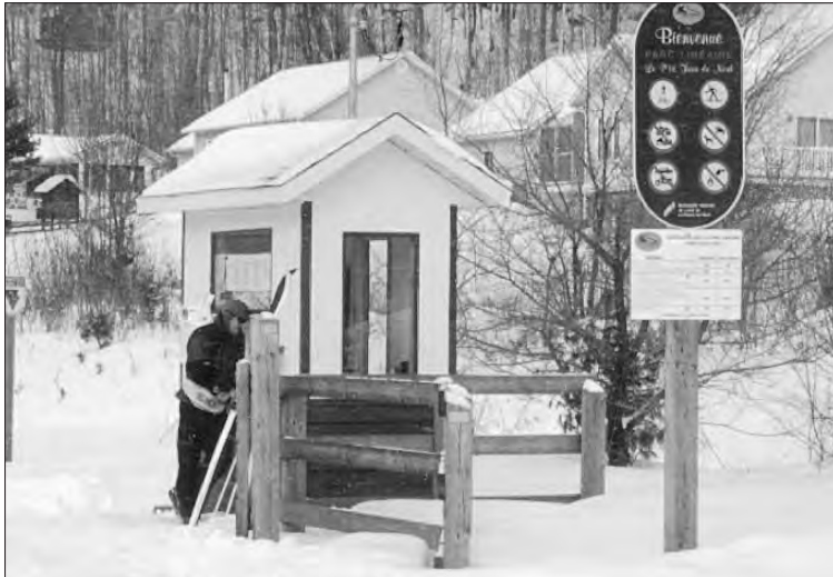
Au kilomètre 14, le parc porte le nom de « Parc linéaire du P'tit train du Nord ».

Finalement, il semble que «quelqu'un» ait pris la décision