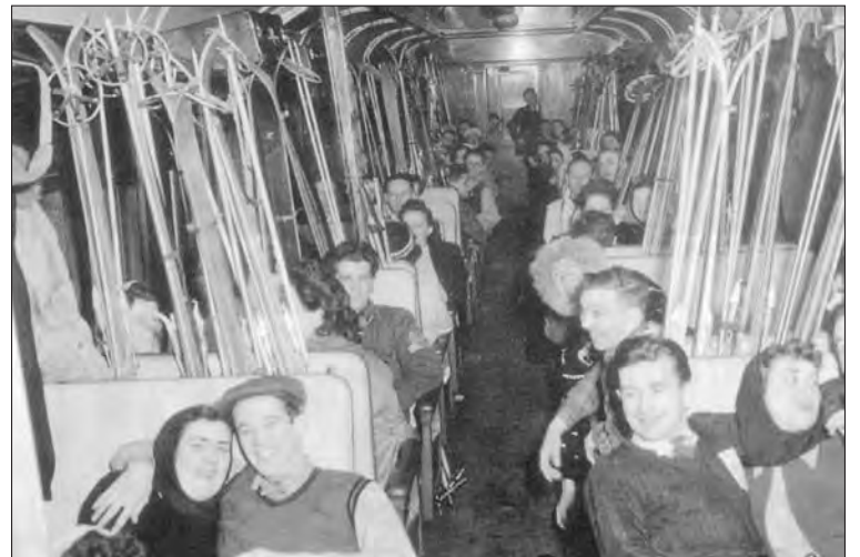
Photo prise à l'intérieur d'un «Ski train» du Canadien Pacifique à la belle époque. On dit que ça sentait la cire pour les skis, les oranges et le cigare. La bonne humeur et la camaraderie étaient de mise.