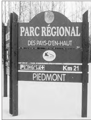
Au Kilomètre 21 à Piedmont, le parc linéaire change de nom pour s'appeler le « Parc régional des Pays-d'en-haut. Beaucoup de confusion pour les visiteurs et les usagers.

Plusieurs se demandent s'ils se sont égarés ou si la passe qu'ils viennent d'acheter au gros prix est encore valide.