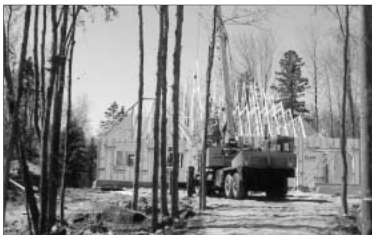
Cette construction à l'intention d'un propriétaire en fauteuil roulant comporte un seul étage, mais pour respecter le règlement d'urbanisme, la maison aura un faux toit créant une illusion de deux étages.