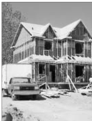
Cette photo illustre bien l'activité fébrile caractérisant la construction.

Déjà, les statistiques du service de l'urbanisme de Prévost indiquent à ce jour que 63 demandes pour de nouvelles résidences ont été déposées au service d'urbanisme comparativement à 71 permis accordés pour toute l'année 2000.