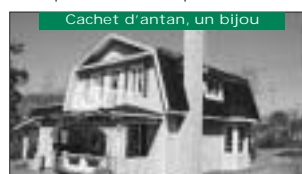
Cachet d'antan, un bijou Tout rénové, terrain de 33000pc. 124 900$