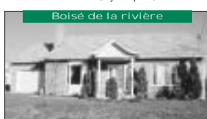
Boisé de la rivière Foyer, piscine h-t, près de l'école dans un croissant 125 000$