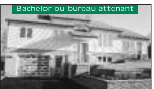
Site magnifique, très privé