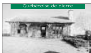
Québécoise de pierre Plancher et armoires de bois, foyer de pierre, s-s fini. 95 000$