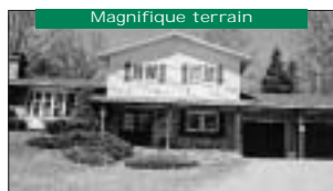
Magnifique terrain Sans voisin, près de tout. 169 900$