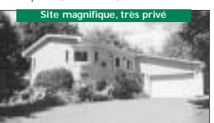
Belle architecture, spacieux terrain 47 000pc 164 900$