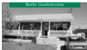
Belle Québécoise Au domaine Laurentien, 3 cac, sous-sol fini. 98 500$