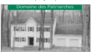
Domaine des Patriarches Foyer, 3 étages, plancher tout bois 225 000$