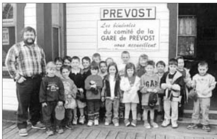
La semaine dernière les "grands" de la garderie L'Abri-Doux sont venus visiter la gare de Prévost. Une occasion unique de conjuguer le passé plus que centenaire de la gare avec l'avenir de la communauté prévostoise. Dans quelques années, ces jeunes prendront peut-être la relève des bénévoles du Comité de la gare.

Au hasard de leur promenade sur le Parc linéaire, les enfants ont aussi pu cueillir des pissenlits et découvrir des chenilles. Les éducatrices en ont profité pour les familiariser avec ces petites bestioles et leur faire comprendre qu'il ne faut pas avoir peur de tout ce qui est nouveau et différent.