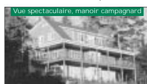
Vue spectaculaire, manoir campagnard 4 cac., dans un croissant, accès facile à l'aut. 269 900$