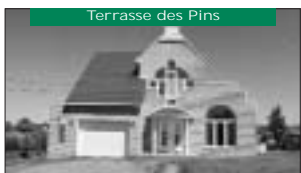
Terrasse des Pins Terrain 150 000pc, très spacieux, foyer. 129 000$