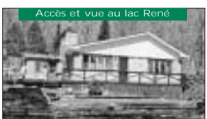
Accès et vue au lac René Terrain boisé, 17 000pc, foyer de pierre. 89 900$