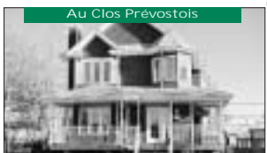
Au Clos Prévostois Plancher tout bois, foyer, 2 min. de l'école. 139 900$