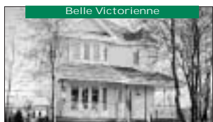
Belle Victorienne Tout près de l'école, 4 cac, pisc.h-t. 149 900$