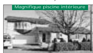
Magnifique piscine intérieure Au cœur de Prévost, grande qualité de construction