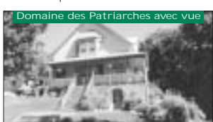
Domaine des Patriarches avec vue Plancher tout bois, un bijou. 164 900$