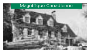
Magnifique Canadienne Aucun voisin arrière, 2 foyers. Prix 175 000$