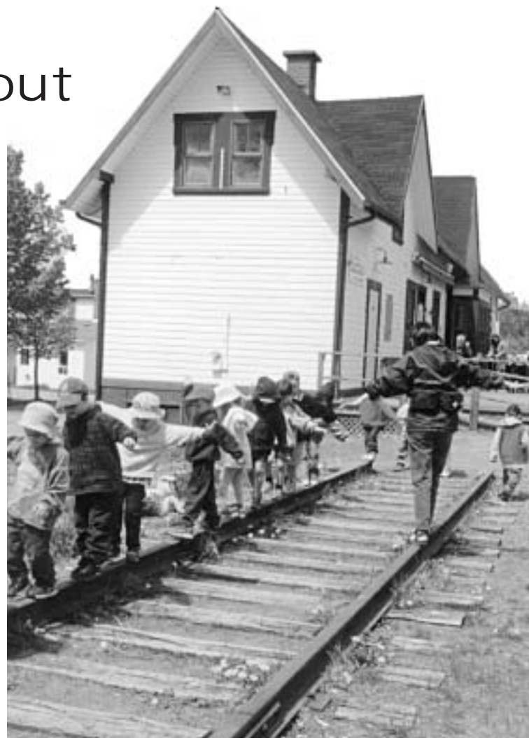
Apprendre à marcher en équilibre sur un rail, voilà un très bon exercice pour développer le sens de l'équilibre chez les enfants.