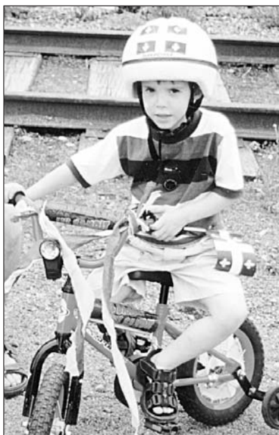
À la Saint-Jean, Jobatam, affichait ses couleurs comme plus de 1 200 prévostois. À lire en page 24.