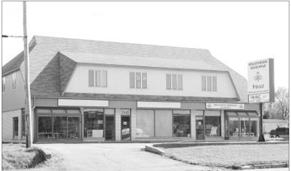
L'édifice du 2945 boul. Labelle sera acquis officiellement par la ville d'ici quelques jours.

Depuis le déménagement de la bibliothèque le nombre d'abonnements a presque doublé et de nombreuses activités reliées à la lecture ont été tenues dans cet édifice qui est maintenant beaucoup plus accessible.