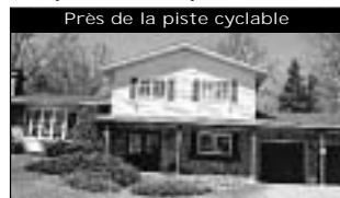
Près de la piste cyclable Avec la montagne à l'arrière. Maison à paliers, 3 cac + 1 bureau. 153 000 $