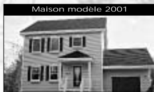
Maison modèle 2001 Au Clos Prévostois, style Nouvelle Angleterre, 3 cac. 136 500 $