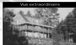
Vue extraordinaire De style montagnard dans un croissant avec accès rapide à l'autoroute, 4 cac, 3 sdb, plancher tout bois. 269 000 $

ESTIMATION GRATUITE DE VOTRE PROPRIÉTÉ 2 bureaux pour vous servir Sutton St-Jérôme et St-Sauveur