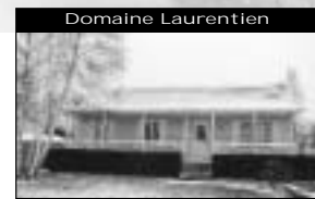
Domaine Laurentien Belle Québécoise, rue paisible, près de piste cyclable, école et parc, 3 + 1 cac. 98 500 $