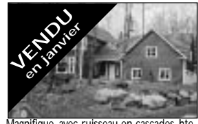
Vendu en janvier Magnifique, avec ruisseau en cascades, hte-qual. de construction, 4 cac + bureau avec entrée indépendante. 275 000 $