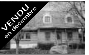
Vendu en décembre Au Domaine Laurentien, terrain 10000 pc, privé, 3 cac. Tout près de l'école. 124 900 $