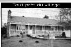
Tout près du village 3 cac à coucher, foyer de pierre, spa, garage, bachelor. 119 900 $

Pour de l'information sur le marché immobilier à Prévost, contactez 2 agents d'ici