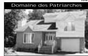
Domaine des Patriarches Intérieur élégant, hte qualité de construction, plancher de bois, foyer. 185 000 $