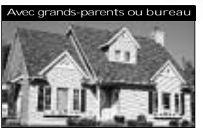
Avec grands-parents ou bureau Superficie habitable 2600 pc avec parc naturel, terrain 14 350pc avec services.