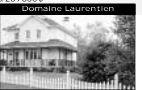
Domaine Laurentien Charmante victorienne, 3 cac, pl. de bois, porte française, comb. lente. 129 900 $