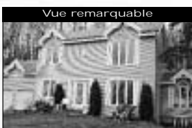
Vue remarquable Site privée, 3 + 1 cac, solarium, salle familiale, 2200 pc de superficie habitable. 174 900 $