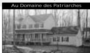
Au Domaine des Patriarches Construction haute-qualité 2000, 3 cac, 1 bureau, garage double. Intérieur élégant. 249 900 $