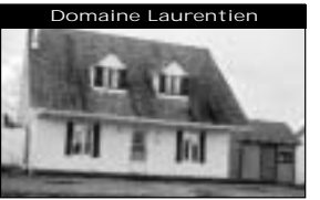
Domaine Laurentien Jolie Canadienne, intérieur chaleureux, plancher tout bois, s-s fini, pisc. h. t. 114 900 $