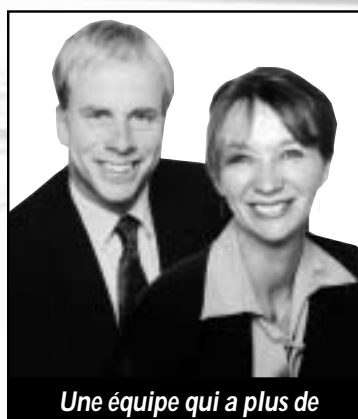
Une équipe qui a plus de 15 ans d'expérience en immobilier

ESTIMATION GRATUITE DE VOTRE PROPRIÉTÉ 2 bureaux pour vous servir Sutton St-Jérôme et St-Sauveur