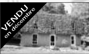
Vendu en décembre Sur grand terrain privé à 2km de la 117, planchers de bois, 2 + 1 cac, bachelor. 119 900 $