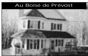
Au Boisé de Prévost Sans voisin arrière, très privé, balcon dans la chambre des maîtres, bachelor au s-sol. 134 900 $