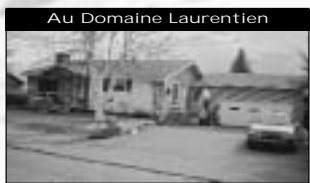
Au Domaine Laurentien Grand bungalow, s-sol fini, garage double. Grand atelier avec entrée ext., terrain 15000pc, 94 900 $