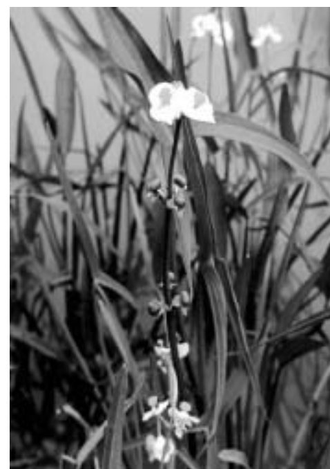
Sagittaire à larges feuilles

Il réussit à nous convaincre de remettre en question nos beaux principes sur la terre, de changer nos habitudes horticoles, de recycler nos