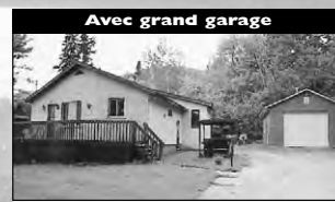
Avec grand garage Bungalow, 3 cac, terrain. 89 900 $