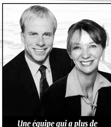
Une équipe qui a plus de 15 ans d'expérience en immobilier