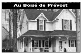
Au Boisé de Prévost Charmante, impeccable sur beau terrain 4200pc. 139 900 $