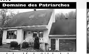
Domaine des Patriarches Grand salon, plafond cathédrale, planchers et portes de chêne. Thermopompe. 139 900 $