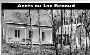
Accès au Lac Renaud Charmante construction 2001, beau terrain privé, 2 cac, garage, 2 étages. 134 900 $

Confiez la vente de votre propriété à des agents spécialisés qui habitent le secteur L'assurance d'obtenir le maximum