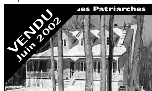
VENDU Juin 2002 Sur beau terrain boisé, cachet champêtre, poutres au plafond, garage. 169 900 $