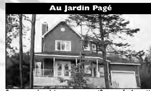
Au Jardin Pagé Secteur recherché avec vue magnifique et forêt arrière. Beau décor intérieur, construction 2000. 208 000 $