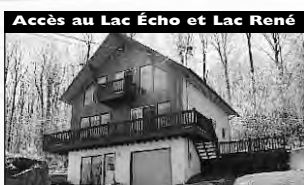
Accès au Lac Écho et Lac René A Prévost, accès pour embarcation à moteur, terrain 30 000 pc avec vue magnifique, 3 cac. 169 900 $