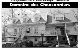
Domaine des Chansonniers Sur beau terrain, grande pièces sur pièces, impeccable. Idéal pour garderie, auberge, bachelor. 249 000 $