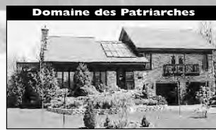
Domaine des Patriarches Construction haute-qualité, plafond cathédrale de bois, Design intérieur, un bijou! 2 foyers, terrain 23 000 pc. 249 000 $