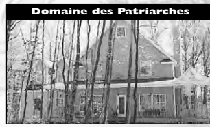
Domaine des Patriarches Magnifique propriété style ancestrale, construction 2001, sup. hab. 3000 pc, galerie 3 côtés, 4 cac. 275 000 $