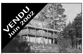
VENDU Juin 2002 Style montagnard dans croissant, accès rapide à l'autoroute, 4 cac, 3 sdb, plancher tout bois. 269 000 $