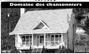
Domaine des chansonniers Jolie campagnarde avec vue sur les prés et montagnes, 3 cac, foyer, bachelor 3 1/2. 125 000 $