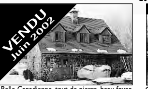
VENDU Juin 2002 Belle Canadienne, tout de pierre, beau foyer central. Terrain 46 585 pc, sup. hab 1780 pc. 174 900 $