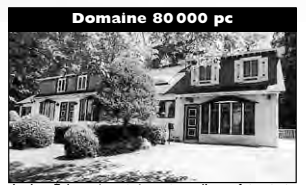
Domaine 80 000 pc Au Lac Écho, très privé, maison d'autrefois, piscine creusée, cabane à sucre, bureau avec entrée indépendante, 3 cac, 3800pc habitable.