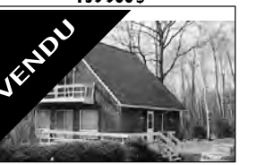
VENDU Charmante Suisse, accès au Lac René, Impeccable. 109 900 $