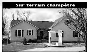
Sur terrain champêtre De style américain, 5 cac et vue sur les montagnes, plancher tout bois avec bachelor. 218 000 $