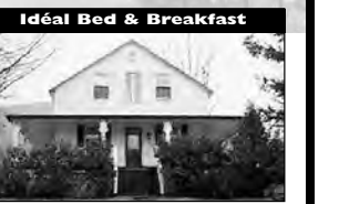
Idéal Bed & Breakfast Impeccable et charmante, 4+1 cac avec grande salle de réunion, cachet chaleureux. 149 900 $