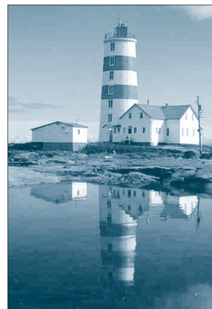
Le phare de la Pointe-des-Monts un endroit magique en pleine mer.

Les amoureux de la nature ont le choix de demeurer contemplatifs pendant plusieurs heures, ce qui fut mon cas lors de ma première visite, ou de profiter des activités offertes, telles les excursions à la baleine et aux phoques, le kayak de mer, la pêche en mer, celle à la truite ou au saumon sur des lacs avoisinants, le vélo de montagne, l'observation des oiseaux (aigle-pêcheur, fou de bassan, crèche de jeunes eiders), la cueillette de petits fruits sauvages ou encore en automne la chasse au canard, à l'orignal et à l'ours. Pas de quoi s'ennuyer.