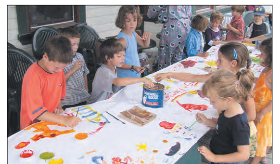
Même les enfants du camp de jour ont mis leurs pinceaux à l'eau pour célébrer les couleurs de Prévost à leur façon.