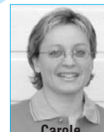
Carole D.E.P. production horticulture