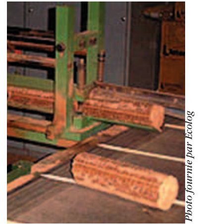
À l'aide d'un équipement ultra moderne, il est possible de produire près de 5000 bûches par jour, soit une bûche à toutes les 6 secondes.

Si l'on considère que 660 bûches de 3 lbs (Éco-logic) ou 900 de bûches 2.2lbs (Éco-logic) seront nécessaires pour fournir l'équivalent calorifique de 6 cordes de bois franc sec, on peut penser que les bûches écologiques représentent un avantage indéniable puisqu'il suffit de 112 pi 3 pour entreposer le