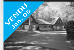
Accès au Lac René

VENDU Jan. 05 Belle propriété toute rénovée, beau cachet intérieur, sur terrain magnifique de 43 510 pc, boiserie poutre verrières. 197 900 $