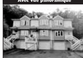
Avec vue panoramique

Magnifique condo, unité de coin, sur un site splendide avec vue panoramique. Terrain privé de 15 203 pc, forêt arrière. A deux pas de l'autoroute, 30 mi. de Montréal, 3 cac. — 149 900 $