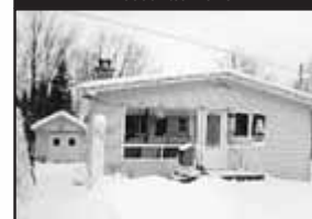
Accès lac Écho

Impeccable, foyer de pierre au salon, 3 CAC, verrière, garage. 128 900 $