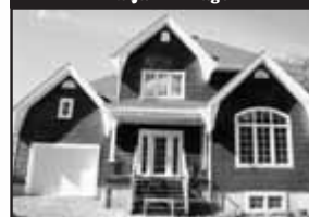
Au Jardin Pagé

Avec forêt arrière, magnifique secteur, bel intérieur 3 cac, sous-sol fini, foyer Jotul, armoires de cuisine de bois. 268 500 $