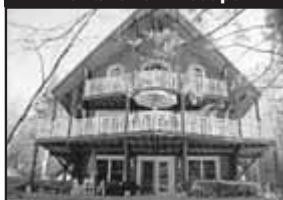
Domaine de 222 000 pc

Secteur lac Écho, propriété 2004, design remarquable avec galeries 4 côtés, beau cachet intérieur, haute qualité. 379 000 $