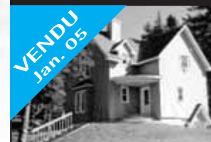
Domaine des Patriarches

VENDU Jan. 05 Spacieuse, ensoleillée, beau point de vue sur les montagnes, belle construction. 217 900 $