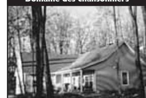
Domaine des chansonniers

Magnifique plein pied, 3 CAC, planchers de pin rouge, bureau, garage, véranda. 269 000 $