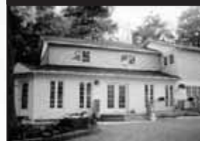
Domaine au bord du lac Écho

Wow! Sur magnifique terrain de 42 225 pc, jolie rue sans issue, entouré de beaux arbres. Tout rénové, Possibilité multi-génération ou 2 logis et une 2 e maison 3 saisons. 350 000 $