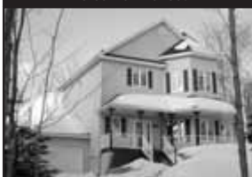
Boisé de Prévost

Sur terrain de 39 000 p.c., spacieuse, plafond 10 pi., boiserie, véranda, pisc. HT. 268 500 $