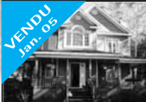
Accès au Lac Renaud

VENDU Jan. 05 Sur beau terrain boisé, bel intérieur, construction 2003, grande galerie, boiserie, foyers. 219 000 $