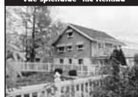
Vue splendide - lac Renaud

Sur beau terrain plat, piscine creusée 40x24, cachet chaleureux, poutres au plafond et murs, 2 foyers de pierre, site de rêve. 399 000 $