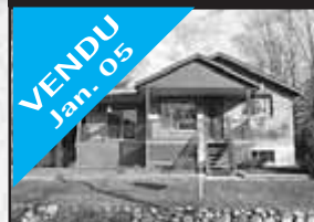
Accès lac Renaud

VENDU Jan. 05 Un bijou! Cachet champêtre, boiserie, salle de SPA 2003, combustion lente, bel aménagement paysagé, à 2 mi. du lac. 138 900 $