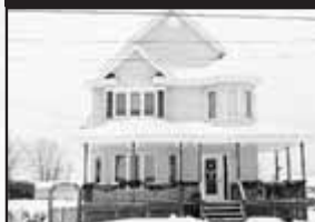
Terrasse des Pins

Planchers tout bois, 3 CAC, S-S fini, sur terrain de 15 000 pc, tout près des pistes cyclables et de ski de fonds. 184 900 $