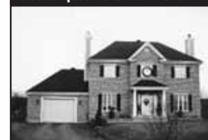
Site unique! Devant ski de fond

À 2 pas du village, devant les pistes cyclables et de ski de fonds, sur terrain de 38 000 pc, piscine creusée, S-S fini, planchers tout bois. 335 000 $