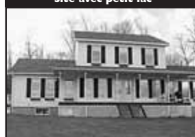
Site avec petit lac

Sur splendide terrain de 125 000 pc, bigénération, bel intérieur champêtre, armoires de bois, garage, 2 étages. 395 000 $