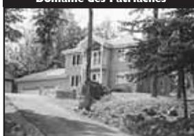
Domaine des Patriarches

Résidence de prestige, avec vue panoramique, piscine creusée, aménagement paysagé pro, haute qualité, air climatisé, beau S-S. 399 000 $