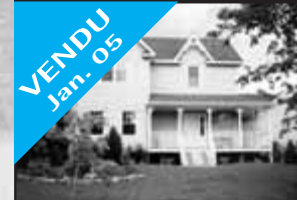
Au Clos Prévostois

VENDU Jan. 05 Sur terrain de 40000 pc dans un croissant, à 3 min de St-Jérôme, près de l'école, pistes de ski de fonds / cyclable, forêt arrières, spa, pergola. 264 900 $