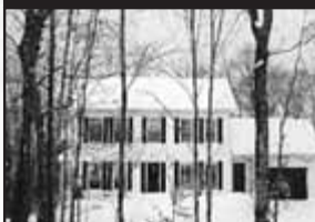
Domaine des Patriarches

Sur beau terrain de 39 000 pc, retirée de la route, privée, boisée, 4 CAC, SPS, S-S fini. 235 000 $