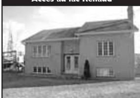
Accès au lac Renaud

Haute qualité de construction, plafonds 9 pi., sous-sol fini, 2 foyers. 268 500 $