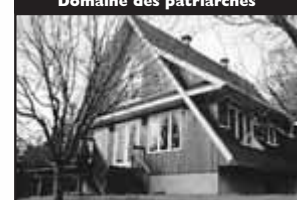
Domaine des patriarches

Avec vue panoramique, belle suisse, spacieux, 3 CAC, 3 SdB, cathédrale de bois. 219 000 $