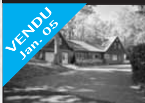
Accès au Lac René

VENDU Jan. 05 Belle propriété toute rénovée, beau cachet intérieur, sur terrain magnifique de 43 510 pc, boiserie poutre verrières. 197 900 $