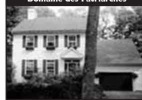
Domaine des Patriarches

Belle Nouvelle-Angleterre, secteur recherché, à 30 mi. de Montréal. Sur beau terrain boisé privé, véranda attenante à la piscine, plafond de 9 pieds, forêt arrière dans la salle à manger, 3 cac. — 325 000 $