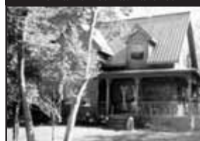
Domaine des Patriarches

Cachet de campagne irrésistible, sur beau terrain avec forêt arrière, retirée de la route, belle cuisine, accès ext. sous-sol, garage double. — 339 000 $