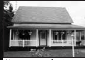
Au cœur du village

Jolie canadienne entourée d'une galerie, secteur familial sur beau terrain de 14 092 pc, forêt arrière, près du golf, tennis, piste cyclable/ski de fonds. Possibilité garderie ou B&B. 3 cac. 182 500 $