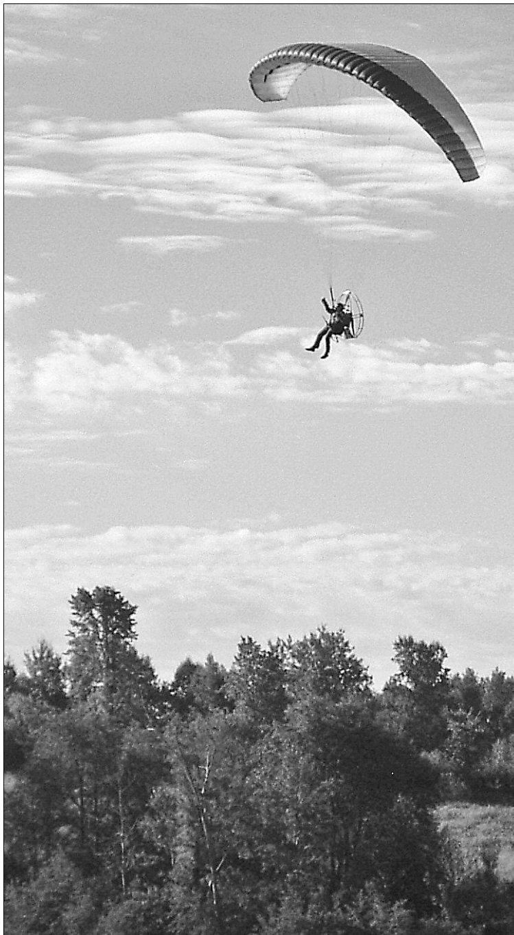
Ça s'appelle un paramoteur, ça pèse 85 lbs et c'est équipé d'un moteur de 28 hp, le train d'atterrissage est composé d'une tordpinouche de bonne paire de jambes.

modèle, les enfants de toute façon, ils ont un très bon jugement, aucun d'entre eux ne rêve de s'asseoir devant la télé avec une bière, ils rêvent de voler comme le monsieur, ou de devenir des Power Ranger ou des Incroyables . Voulons-nous conserver seulement le droit de dormir et de payer des taxes? Ça s'en vient si on ne fait pas attention. En passant, soyez prudent! Si vous traversez Prévost d'est en ouest, tout ce que vous transportez s'ul top du char se fera arracher violemment par le gabarit du pont Shaw!