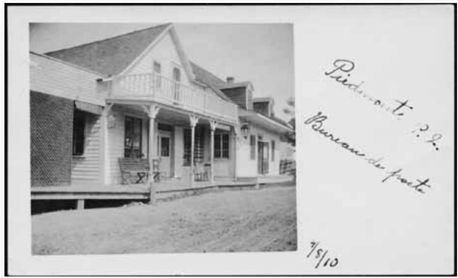
BENOIT GUÉRIN - Carte postale mise à la poste le 5 août 1910.