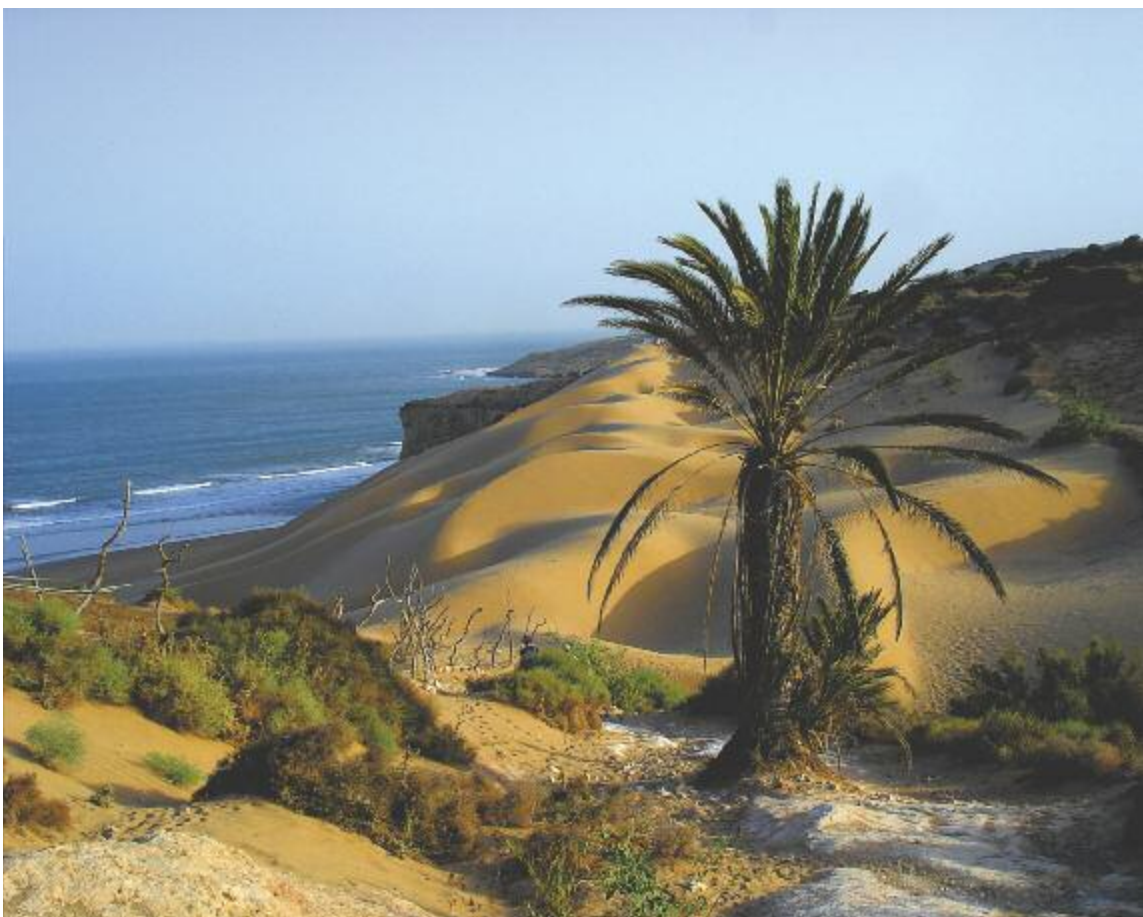
En plus des photos exposées, vous pouvez lire des petites notes informatives ou poétiques sur l'image. Par exemple, « Nous vivons l'une des pires canicules qu'a connues le Maroc depuis les dix dernières années. », Ugo Monticone.