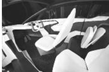
La Honda P-NUT_Concept, voiture coup de cœur de l'auteur, admettez que c'est joli!