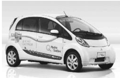
La Mitsubishi Innovative Electric Vehicle est une voiture à 100% électrique, rechargeable au moyen d'une prise de courant ordinaire, pouvant transporter confortablement quatre personnes. Cinquante de ces voitures seront mises en circulation à Boucherville selon l'entente annoncée par Hydro-Québec.

On y retrouve aussi une collection remarquable de microvoitures, datant pour la plupart des années 50 et 60, dont la détentrice du record Guinness de la plus petite voiture du monde homologuée pour la route, la Peel P50 . Elle mesure 134 centimètres de long (deux fois moins que la Smart ForTwo ) par 99 centimè-