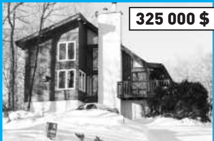
Ste-Anne-des-Lacs, MLS 9872194 Chaleureuse à souhait, vue panoramique sur la vallée, accès notarié au lac des Seigneurs.