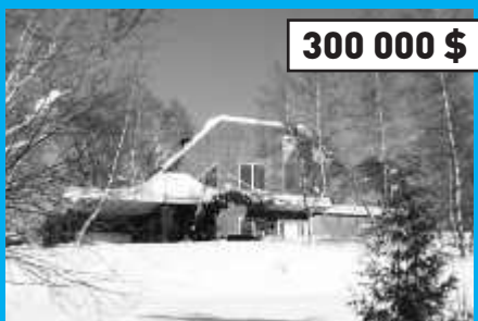
Ste-Anne-des-Lacs, MLS 9773723 Une résidence au design original, planchers de bois franc, suite des maîtres, beau secteur.