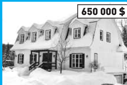
Ste-Anne-des-Lacs Construction récente sur un grand terrain paysager bordé par un ruisseau. Piscine creusée, possibilité d'intérogénération.