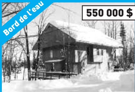
Ste-Anne-des-Lacs, MLS 10888045 Magnifique réalisation de l'architecte Luc Durand, vue incroyable sur le lac de la Canardière.