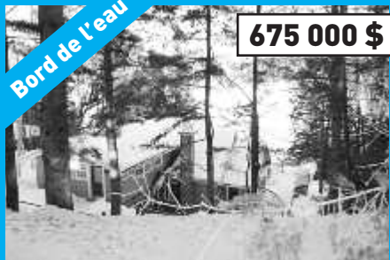
Ste-Anne-des-Lacs, MLS 10410457 Bord du lac Guindon, très privé. Vue du lac saisissante de presque toutes les pièces de la maison.

Andrée Cousineau Courtier immobilier agréé 450 224-4483 www.immeublesdeslacs.com acousineau@immeublesdeslacs.com