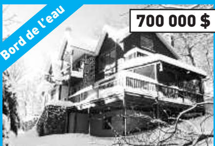
Ste-Anne-des-Lacs, MLS 9082852 Maison au bord du magnifique lac Ouimet, suite des maîtres avec balcon, salles de bains rénovées. Libre à l'acheteur.