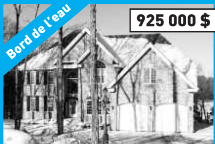
Ste-Anne-des-Lacs, MLS 9898490 Prestigieuse résidence au bord du lac de la Canardière avec près de 220 pi de frontage.