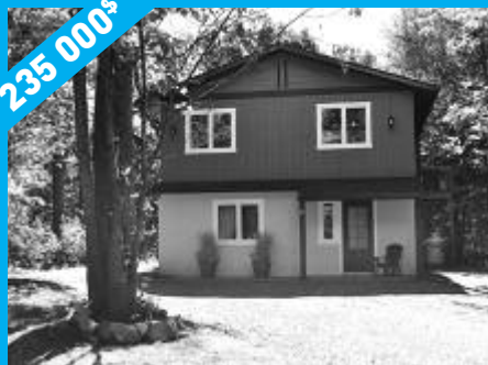
Sainte-Anne-des-Lacs - Toute rénovée MLS 23963665