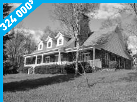
Sainte-Anne-des-Lacs - Véritable pierres des champs MLS 12092499