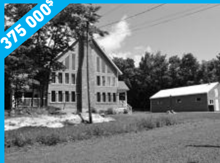
Sainte-Anne-des-Lacs - Immense garage-atelier MLS19211194