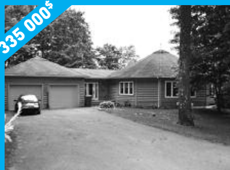
Sainte-Anne-des-Lacs - Reprise de finance MLS 14991980