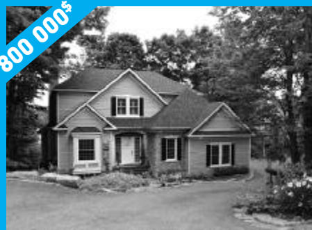
Sainte-Anne-des-Lacs - Bord du lac des Seigneurs MLS 12640469