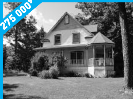
Sainte-Anne-des-Lacs - Secteur paisible MLS23771539