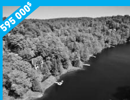
Sainte-Anne-des-Lacs - Bord du lac Ouimet MLS 23742193