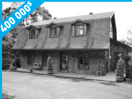
Sainte-Anne-des-Lacs - Inter-génération MLS9831340