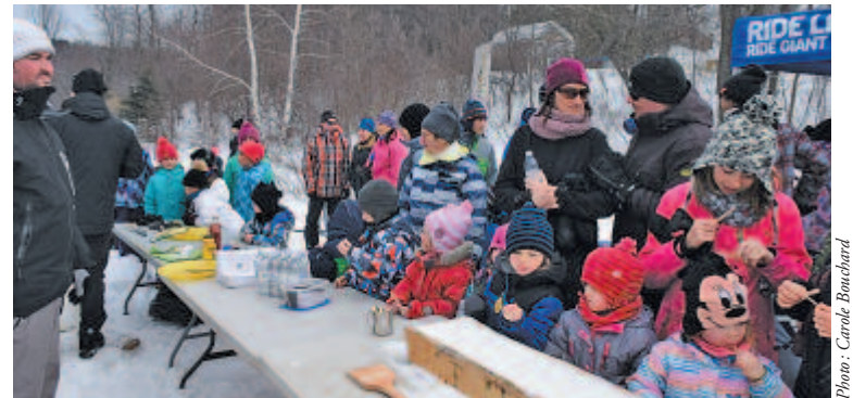
Le Club de plein-air de Prévost a organisé un BBQ en plein air, où saucisses et tire sur la neige ont été très appréciées.