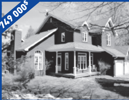
1068, ch. Dunant Sud, Ste-Anne-des-Lacs, JOR 1B0 MLS 20574369