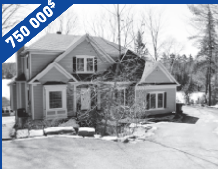
32, des Lilas, Ste-Anne-des-Lacs, JOR 1B0 MLS 22782040

VISITE LIBRE le 19 avril, de 14 h à 16 h