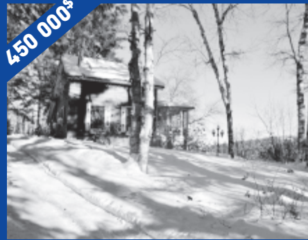
36, ch. Fournel, Ste-Anne-des-Lacs, JOR 1B0 MLS 10831756