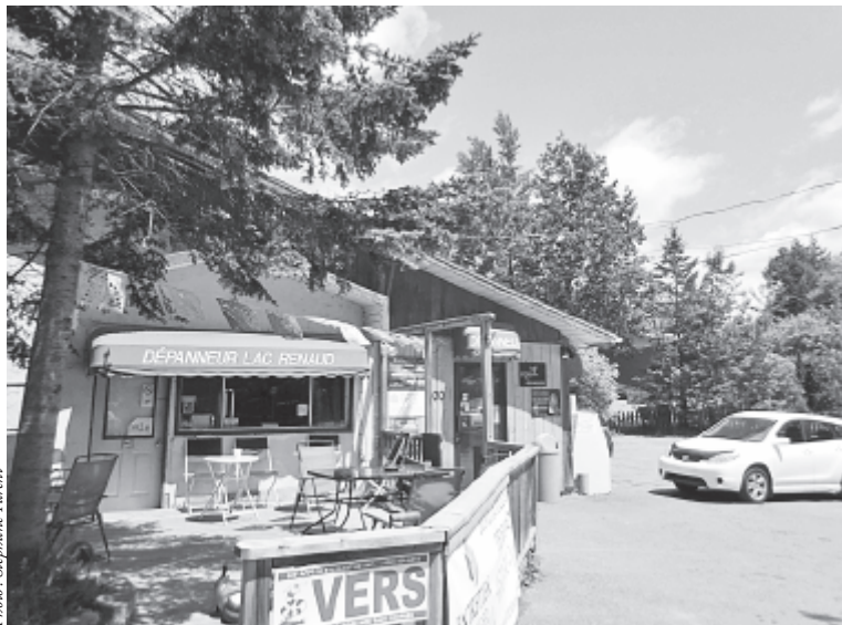
Un dépanneur riche en couleurs tout près de chez vous! Bien plus qu'un ami!

Si la fermeture du Bonichoix de Prévost en a attristé plus d'un, la présence du dépanneur du Lac Renaud offre encore un peu de réconfort aux résidents du secteur.