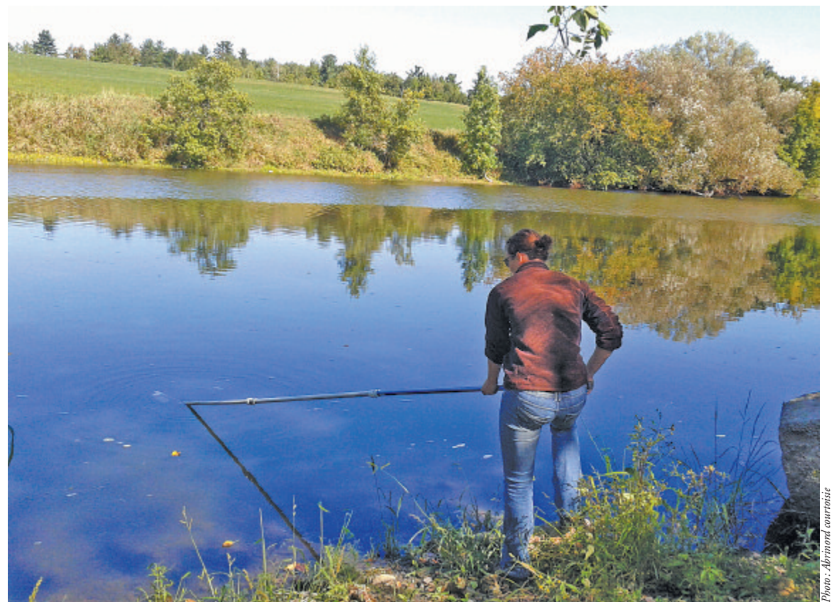
Aller sur les sites choisis afin de prendre les échantillons et les mesures de qualité de l'eau fait partie du programme d'échantillonnage de l'eau, issu du PDE