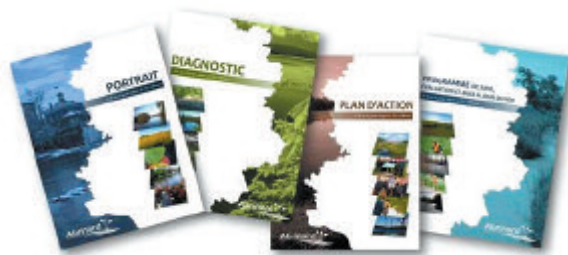
Les quatre sections du PDE, encore en phase préliminaire jusqu'à approbation gouvernementale, disponibles pour consultation sur le site web d'Abrinord.

Le Portrait brosse le tableau de la ZGIE, qui recense 3303 lacs; en d'autres termes, cette première par-