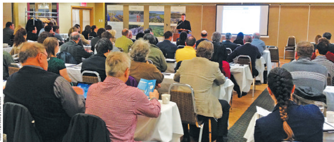
Au Colloque Eaux et Municipalités, activité de formation et de transfert des connaissances.

aux écosystèmes et deux sont de nature sociale. Évidemment, la priorisation est sujette à des modifications potentielles, puisque les urgences peuvent varier dans le temps, en fonction de la création de nouvelles données ou de l'évolution de l'état des cours d'eau.