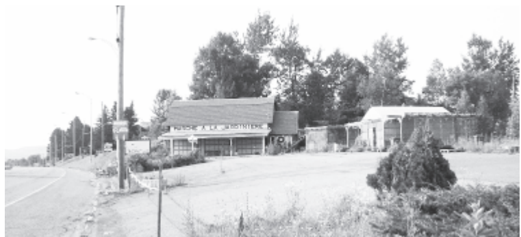
Marché à la Jardinière fera place à une épicerie Métro