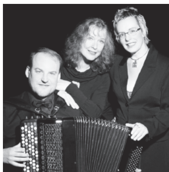
Le Trio Young-Lalonde-Sidorov

Le Trio Young-Lalonde-Sidorov est formé de trois artistes de renom.