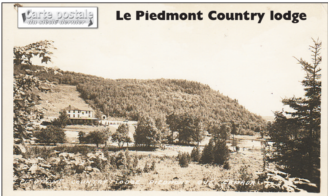
Carte postale originale: collection privée de l'auteur.

L'association des propriétaires de chiens Wouf Laurentides tiendra son assemblée générale annuelle à la gare de Prévost, 1272, rue de la Traverse, le 21 mars 2016, à 19 h 30. Info: 450-335-1140.