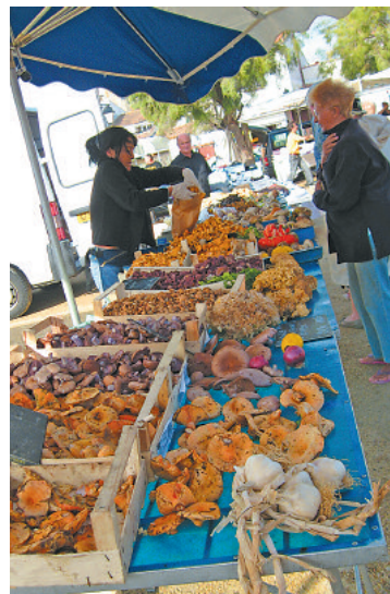
Grande variété aux Saintes-Marie-de-la-Mer

Parce qu'ils sont si nombreux, les mycologues français doivent subir de multiples contraintes. La cueillette