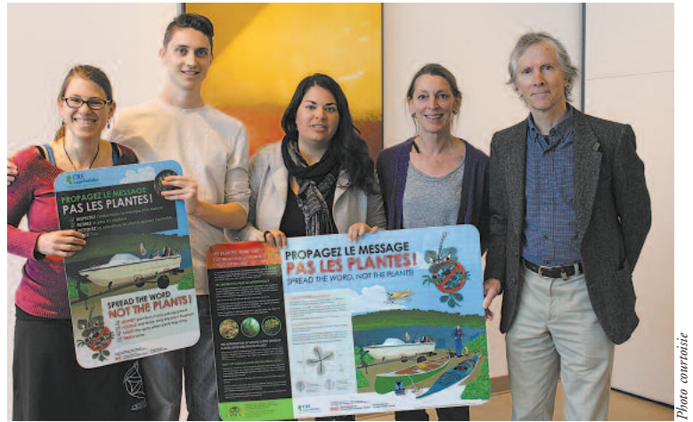
Le CRE Laurentides a convié la population des Laurentides et a présenté son slogan «Propagez le message, pas les plantes!»

Neuf formations pour la détection des PAEE (plantes aquatiques exotiques envahissantes) et pour l'identification des plantes aquatiques se sont déroulées au mois de juin dans