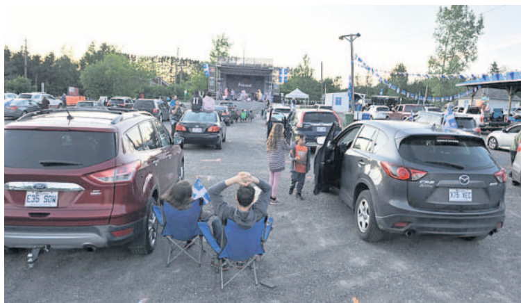
Formule ciné-parc, c'est ainsi que le spectacle de la Fête nationale Atrocetomique 25 , un hommage aux Colocs a été présenté au Marché aux puces le 23 juin dernier