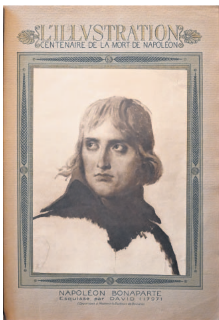
Napoléon Bonaparte, selon une esquisse de David réalisé en 1797 alors que Napoléon avait 28 ans. L'œuvre appartenait au moment de sa publication à Madame la Duchesse de Bassano. Elle fut publiée lors du centenaire de la mort de Napoléon dans la revue L'Illustration. Cet illustre hebdomadaire, créé en 1843, est en quelque sorte la paris match de son époque. Cet hebdomadaire mythique a raconté le monde, chaque semaine durant plus d'un siècle, avec le concours des plus grandes signatures de l'époque.