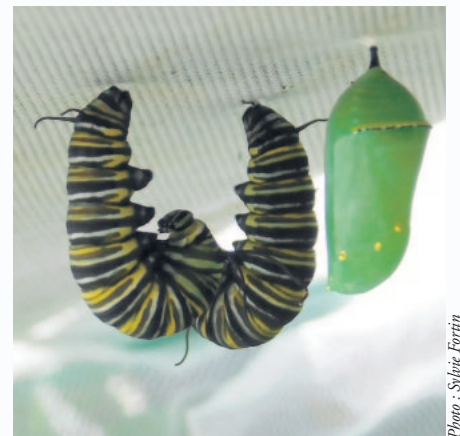
Chenilles et une chrysalide qui complète son cycle de vie!

implantant des oasis sur leur terrain, ce que certains ont déjà fait avec succès.