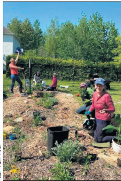
Bénévoles au travail!

Quelques oasis publiques contribuent évidemment à la préservation du papillon monarche, mais nous souhaitons que des citoyens mettent l'épaule à la roue en