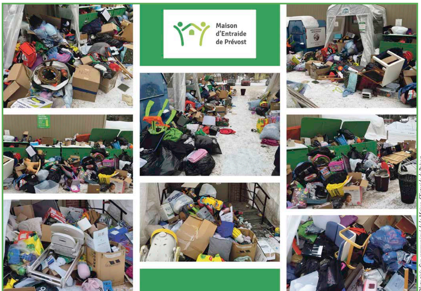
Malgré une demande explicite, des objets ont été déposés et se sont accumulés à l'entrée de la Maison d'entraide de Prévost pendant sa période de fermeture.

Comme l'aurait sans doute formulé Cipolla, le véritable défi n'est pas d'éradiquer les comportements maladroits, mais de rendre leurs effets visibles afin que le geste de donner redevienne ce qu'il doit être : une aide, et non un fardeau.