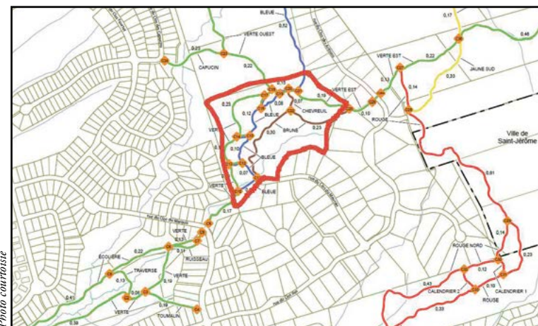
Carte sur laquelle nous pouvons voir les sentiers du parc de la Coulée et le lot de 11 hectares, encerclé de rouge, qui portera une servitude de conservation perpétuelle pour la pérennité du Parc de la Coulée.