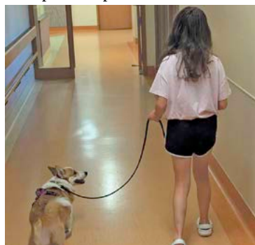
Le chien Joy à l'hôpital Shriners : faire de la physiothérapie différemment !