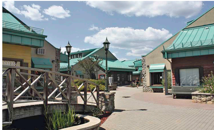
Galeries des Monts à Saint-Sauveur réalisé en 1977

Il avait perdu son épouse, dont l'absence lui pesait profondément. Mais dès que la conversation glissait