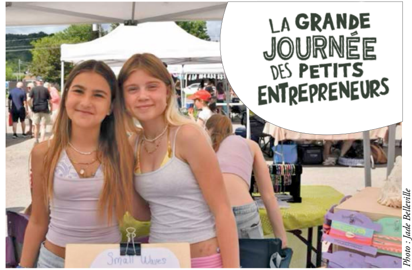
T-shirts, camisoles, colliers et bien plus, tous uniques et colorés.

Parents, amis et citoyens étaient présents en grand nombre pour les encourager et acheter de jolis produits. L'ambiance festive et