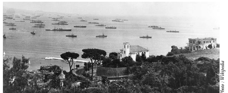
Photo archive du débarquement de Provence

Provence ont consolidé et légitimé de Gaulle comme chef d'un futur gouvernement français. Les succès militaires de l'armée B sont essentiels pour permettre la relance de la renaissance d'un État démocratique et républicain sans passer par une occupation militaire américaine provisoire. De plus, ils assurent à la France d'être considérée vainqueur de la guerre malgré les débâcles militaires et l'Occupation.